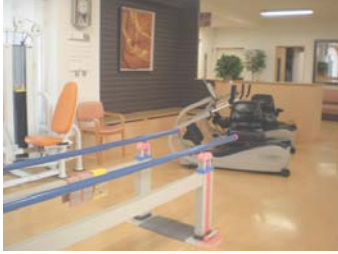
リハビリスペース